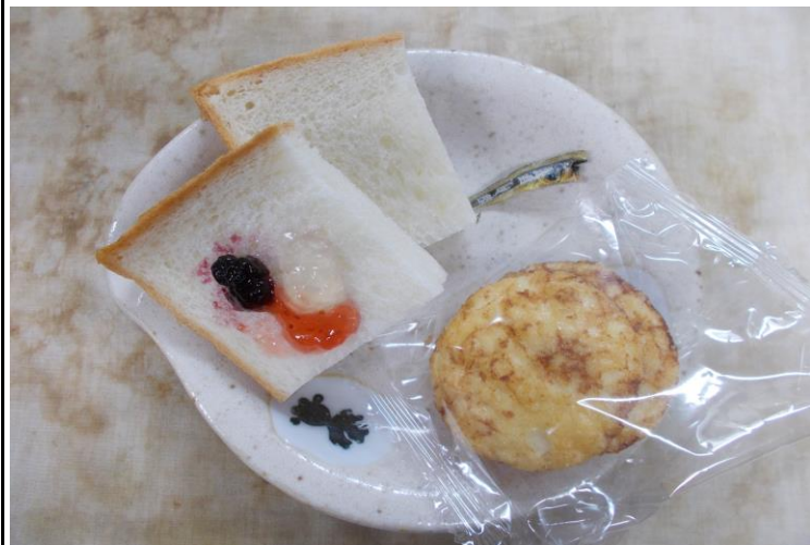
【おやつ：以上児】 パン◎いろいろジャム・炒りじゃこ・お菓子