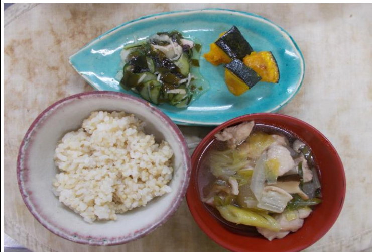
【普通食：以上児】 冬瓜と鶏肉のうま煮・南瓜の塩焼き・たこと胡瓜の酢の物

本日は夏至を意識したメニューになっていて、冬瓜やタコが使われています。たこの足が8本伸びていることにちなんで、稲が四方八方に根付きますように、またタコの吸盤のように稲穂がよく実るようにと豊作祈願をして、タコを食べるようになったといわれています。