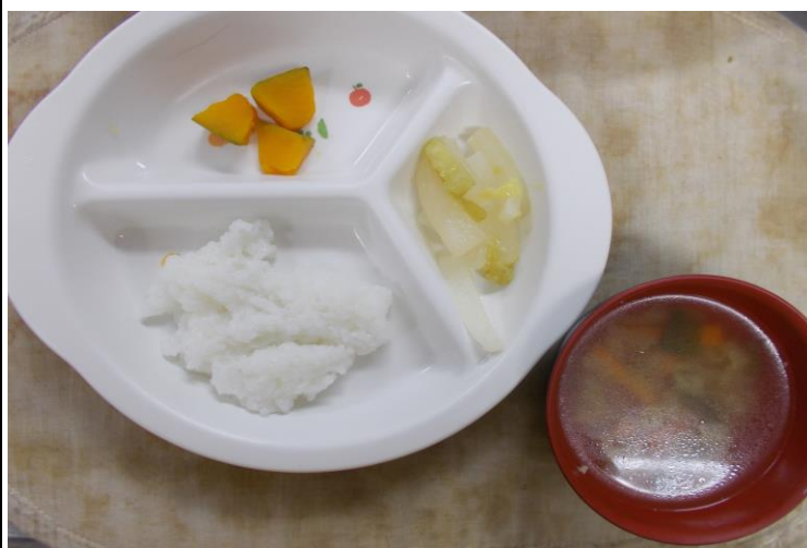
【離乳食】 鶏肉のうま煮・南瓜の塩焼き・胡瓜の和え物